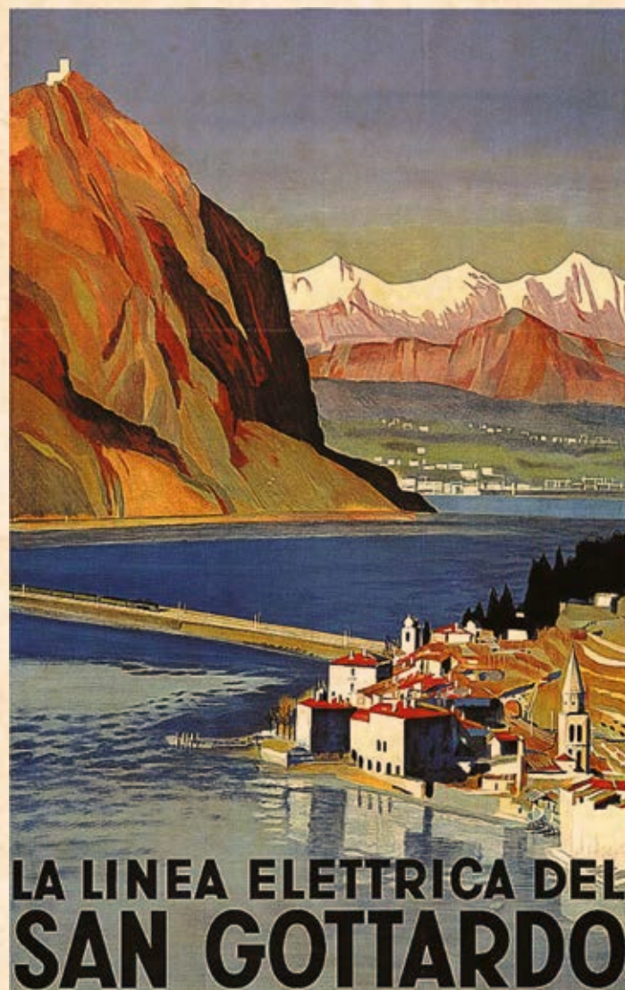
Manifesto dell'elettrificazione di Otto Baumberger (1935). Il San Salvatore spicca sullo sfondo del ponte diga di Melide e del borgo di Bissone.