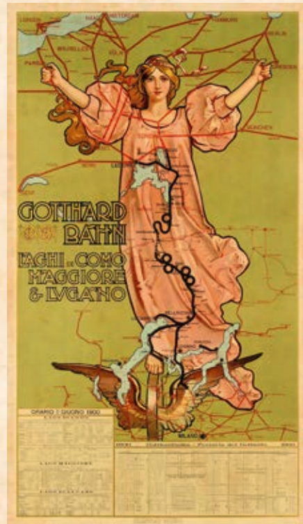
Manifesto di Gabriele Chiattonne del 1900. La leggiadra figura allegorica cavalca la ruota alata a simboleggiare la velocità.