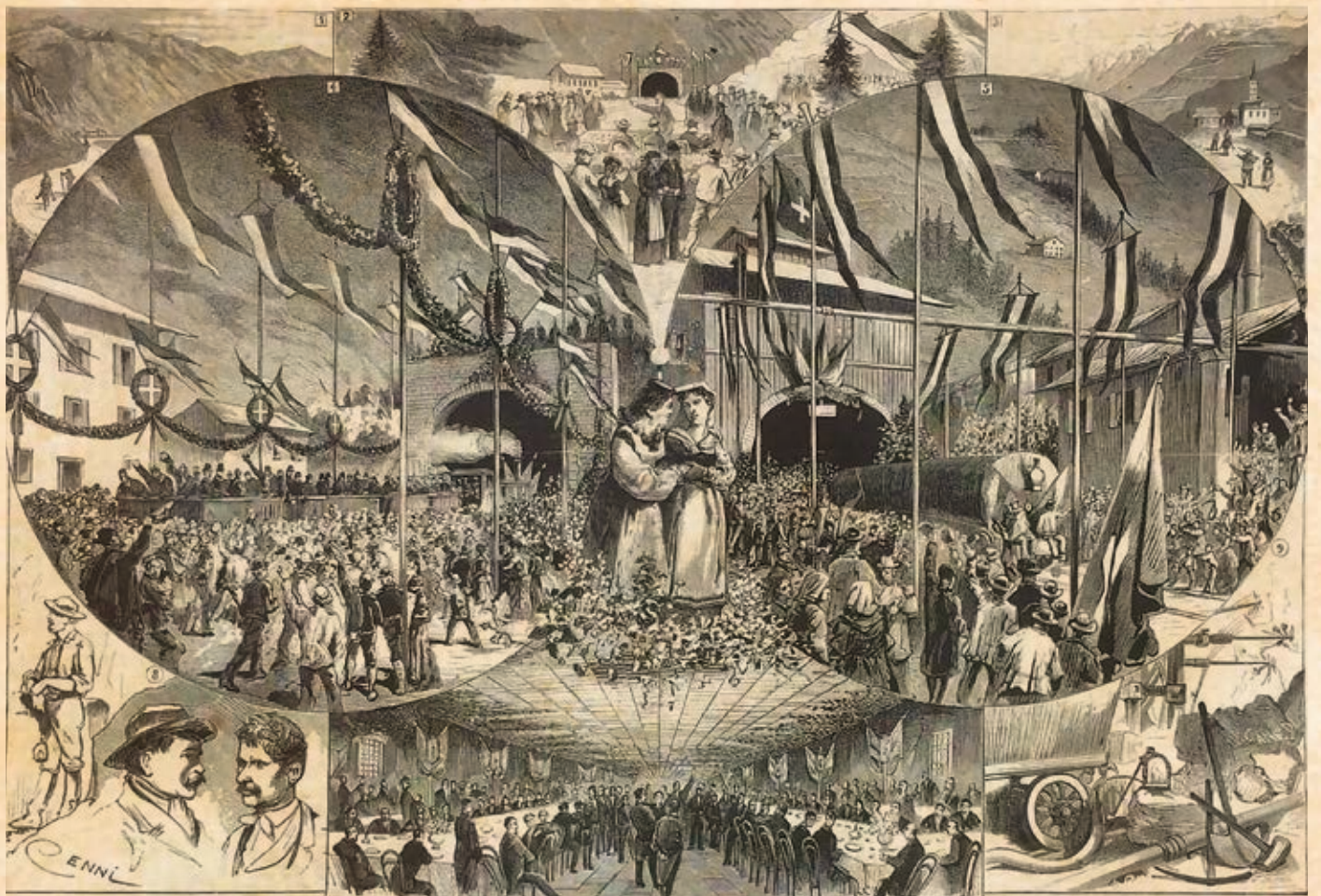
Festeggiamenti ufficiali d'apertura ai portali di Airolo e di Göschenen del 22 maggio 1882.