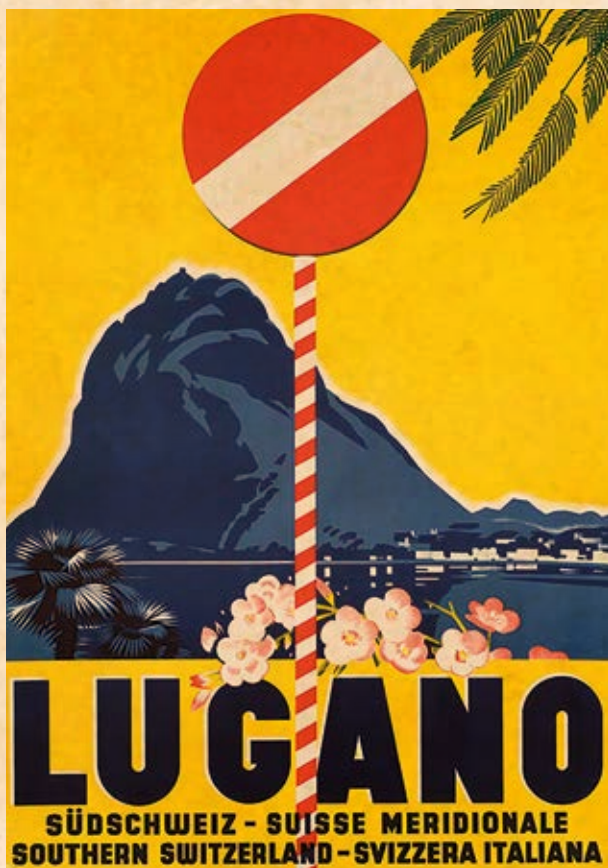
Manifesto (anonimo) del 1932. Il San Salvatore, con la sua caratteristica forma, domina quale elemento trainante per promuovere la città di Lugano.