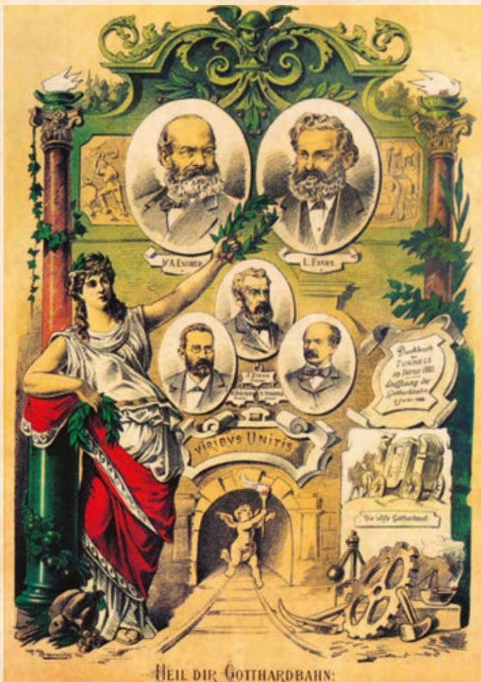
Locandina commemorativa della costruzione e dell'apertura della Galleria del San Gottardo. In alto i ritratti di Alfred Escher e Louis Favre, al centro il consiglio d'amministrazione della Ferrovia del Gottardo nell'anno dell'apertura (1882).