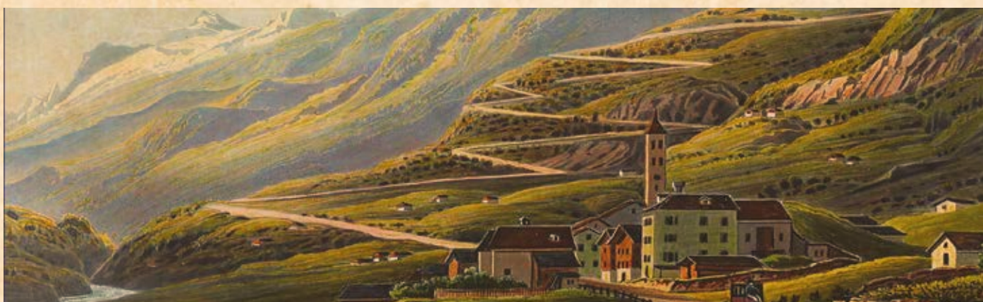
Dai someggiatori alle strade carrozzabili.