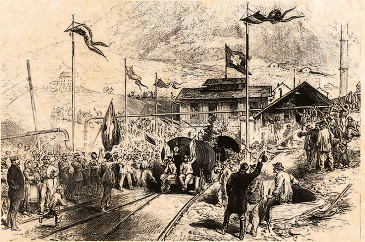
Il primo treno di servizio carico di ospiti attraversa la galleria e arriva ad Airolo il 1° marzo 1880.