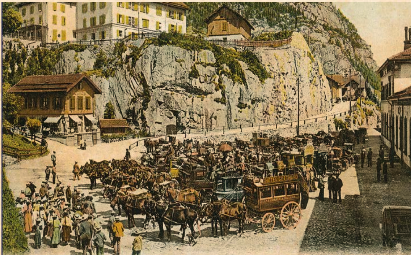
Le carrozze in attesa dei turisti da portare ad Andermatt (1905).